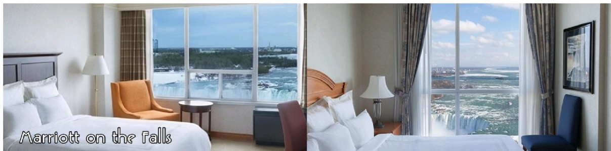
Marriott on the Falls