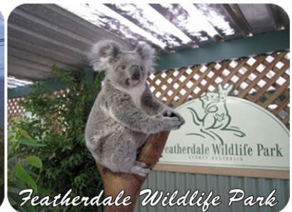
Featherdale Wildlife Park