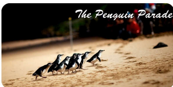
The Penguin Parade at Phillip Island

ค่ำ รับประทานอาหารค่ำมื้ออร่อยกับ “กุ้งมังกร” (Lobster) พร้อมดื่มไวน์ที่เกาะฟิลลิป จากนั้นนำท่านเดินทางกลับสู่เมลเบิร์น / นำเข้าที่พัก